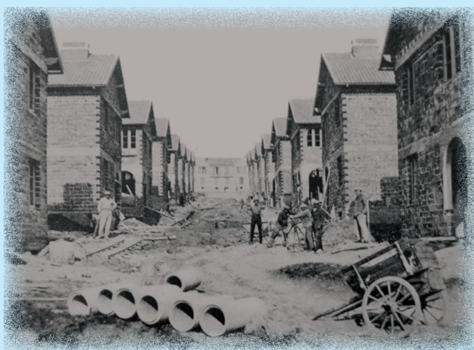
construction des HBM - rue des Bleuets - 1933

Construit au début des années 30, le quartier des HBM, dénommé aujourd'hui Boussicats I, est le premier quartier construit par l'Office Auxerrois de l'Habitat. C'est pourquoi il entre en priorité dans le patrimoine historique de l'Office Auxerrois de l'Habitat. Au fil des décennies, depuis sa construction, le quartier a connu diverses réhabilitations que ce soit sur les façades ou à l'intérieur des logements dans le cadre de l'amélioration de l'habitat.