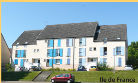
Ile de France