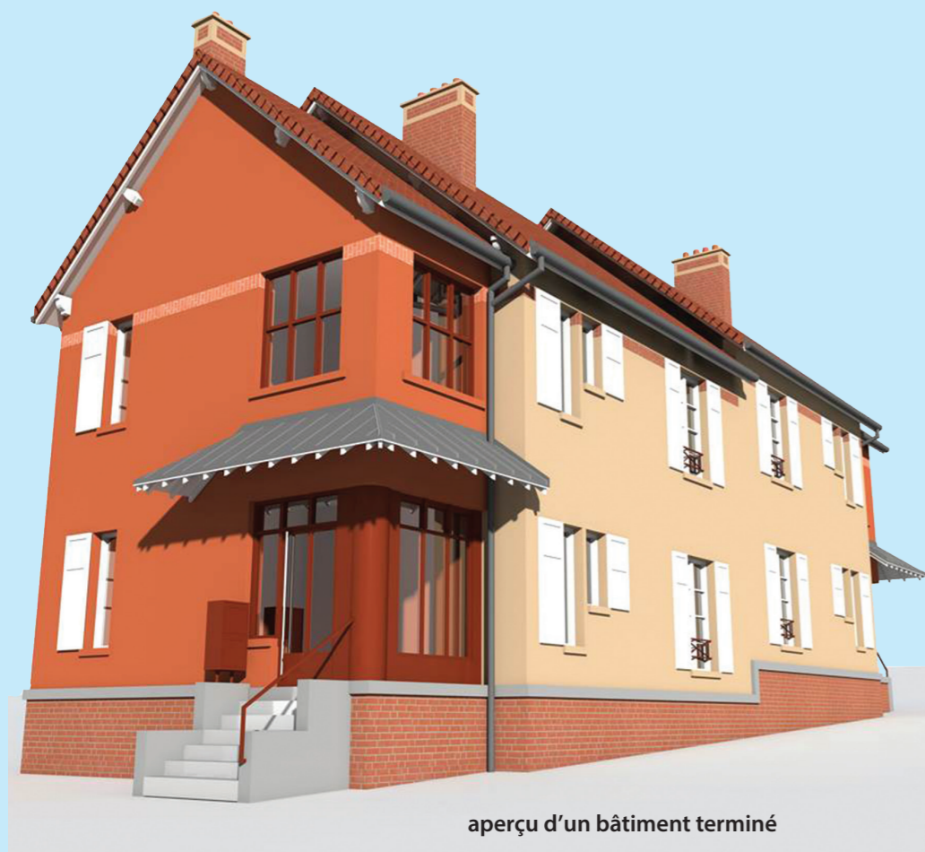
aperçu d'un bâtiment terminé

Les travaux réalisés seront de 3 natures : thermiques, architecturales et techniques.