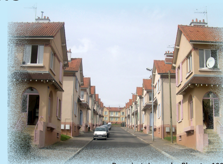
Boussicats I - rue des Bleuets - 1990

Aussi, l'Office Auxerrois de l'Habitat a prévu la réhabilitation énergétique des 142 logements de ce quartier avec pour objectif l'obtention du label énergétique «HPE Rénovation» correspondant à une consommation annuelle inférieure à 195 kWh/m 2 soit environ la moitié de la consommation actuelle.