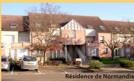
Résidence de Normandie

Dans un quartier calme, proche des commerces, à 5 minutes du centre ville, logements de Type 3.