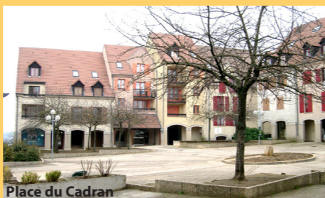
Place du Cadran