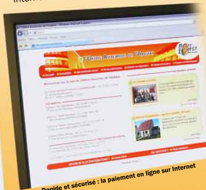
Rapide et sécurisé : le paiement en ligne sur Internet

Dans la continuité de la mise en place du site internet www.habitatauxerrois.fr en ligne depuis juin 2008, l'Office auxerrois de l'habitat vous propose le règlement de votre loyer sur un espace dédié et sécurisé. Au moyen de votre carte bancaire, cette méthode permet un règlement en quelques minutes de n'importe quelle connexion internet.