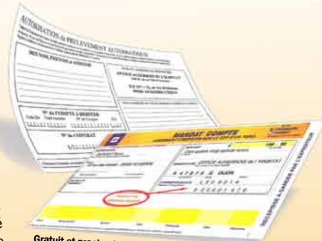
Gratuit et proche de chez vous : le mandat compte

Puis, le mandat compte , entièrement gratuit également, permet un règlement auprès de la poste de quartier ou de n'importe quelle agence postale de France. Ce dernier moyen vous permet de payer votre loyer à proximité de chez vous et évite le transport d'espèces. « Le mandat compte a été bien accueilli par les locataires quand nous l'avons mis en place en novembre 2007. Il est vrai que certains d'entre eux connaissaient déjà ce type de paiement pour régler l'EDF par exemple » indique Bertrand Desbonnet. Votre chargé de clientèle au sein de l'agence de votre secteur est à votre écoute si vous souhaitez choisir un de ces moyens de règlement.