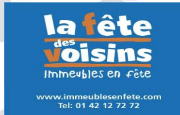
Vendredi 28 mai 2010, les voisins font la fête