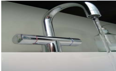
Maîtriser votre consommation